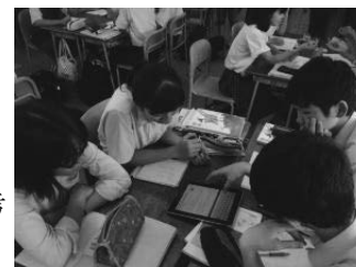
写真2 グループ検討