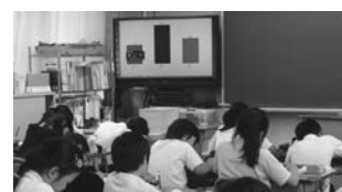
写真8 投票後の様子

投票においては、写真7のレスポンスカード 註2 を使用した。挙手する方法もあるが、数え間違いやそれにかかる時間の短縮、匿名性を考慮した結果、この方法が良いと判断した。投票後、ペアでどちらの句を選んだのか、その理由について話し合った。