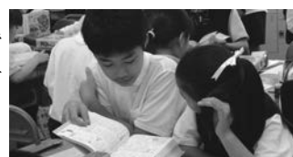
写真6 ペアで話し合う様子

ペアの創作活動では、写真5にあるようにまず個人で創作し、その後ペアで検討するところが多かった。それとは別に写真6のように、初めからペアで言葉や意見を出し合いながら創作するところもあった。