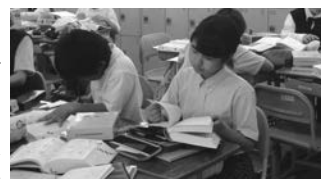
写真5 個人でつくる様子

第2時では、提示した写真をもとにペアで俳句を1つ考えさせた。条件として、「季語が入っていること」「字足らずにならないこと」「二人で話し合って考えること」、の3つを説明した。特に、俳句を創作してペアで1つを作り上げる際、二人の良い方を選ぶのではなく、その言葉を選んだことやその順序にした根拠を伝えられるように強調した。また、言葉を考える際は、国語辞典や類語辞典を使用しても良いことを伝えた。