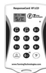
写真7 レスポンスカード

どのペアも、土台となる俳句を作り上げると、工夫して他者に共感してもらえるように国語辞典や類語辞典を使用して言葉選びをしていた。国語辞典や類語辞典を積極的に活用させているねらいは、語彙増やすことである。書く活動において、生徒の多くは「手持ちの言葉」だけしか使用することができず、新たな言葉を増やすためには、その意味を知りその言葉を使用していかなければならない。そのためにも、辞書を活用して語彙を増やすように促した。