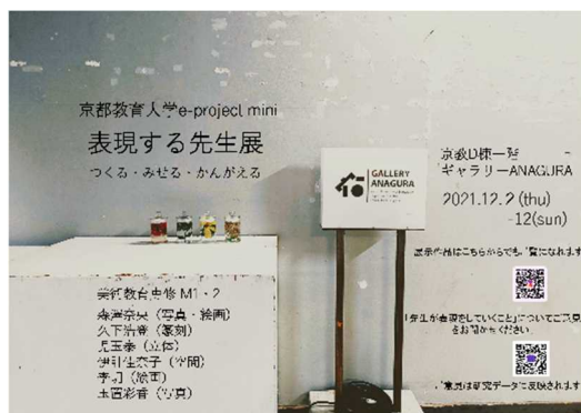
↑作品展をお知らせするポスター 『表現する先生展

「先生が表現をしていくことの意義」についての考えを深めるため、まずは「表現をしていくことの意義」に焦点を絞り、「表現する＝作品展示」に一旦簡略化し、メンバーで作品展を開催した上で、「作品展示を行うことの意義」についてのアンケートを取りました。